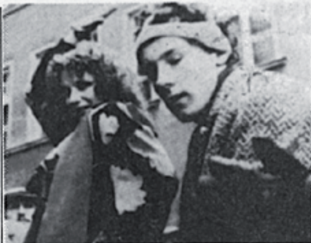
Una scena del polacco «Lago di Costanza», altro film in concorso

La fragilità, ma anche il coraggio del film stanno nel tentativo di ritrarre come normalità un'estraneità: in-